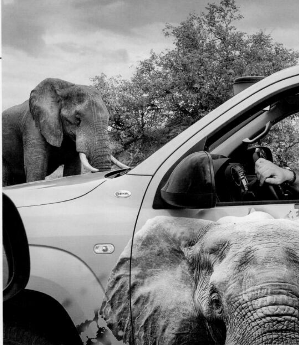
В поисках Большой пятёрки — экспедиция «Вокруг света» в ЮАР . . . . . 38